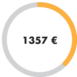
ECOLID, jossa on PriDrive-moottori