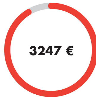
NOSTO-OVI – moottoroitu