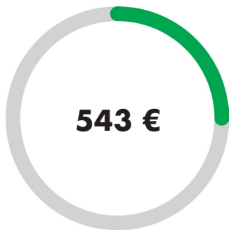
ECOLID – manuaalinen