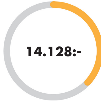
ECOLID med PriDrive motor