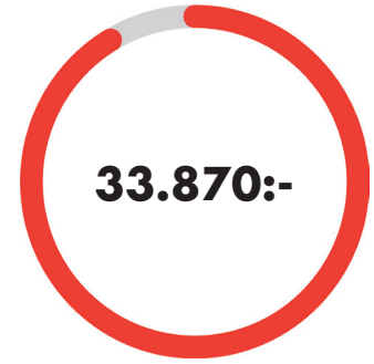
TAKSKJUTPORT - motordriven