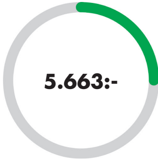
ECOLID - manuell